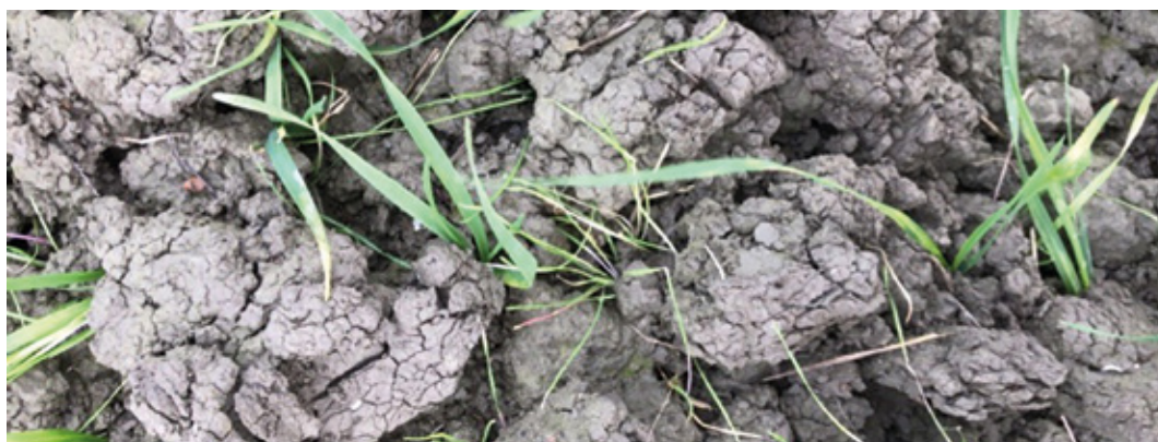
Foto praktijkperceel najaar 2022.

Na opkomst toepassing XERTON. Duistplantjes zijn duidelijk aan het afsterven.