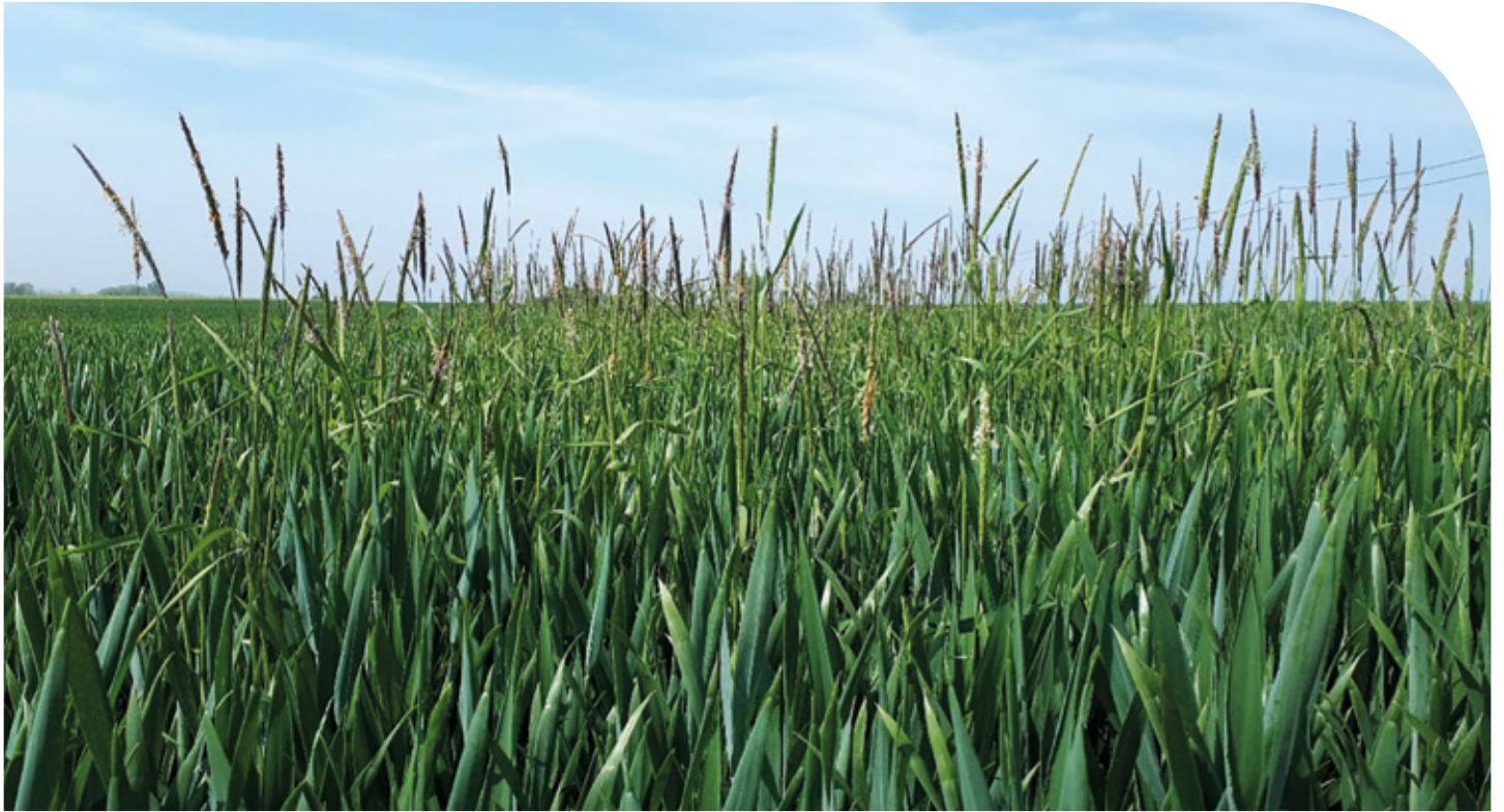
Foto: Perceel tarwe met duist

XERTON bevat de werkzame stof ethofumesaat 417 g/l. XERTON is een SC formulering die speciaal is ontwikkeld voor de na-opkomst toepassing in wintertarwe.